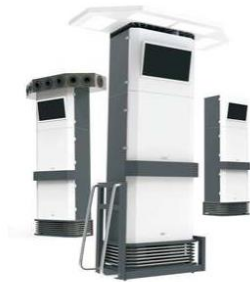
FFC-500V系列净化树（多媒体屏可选装）